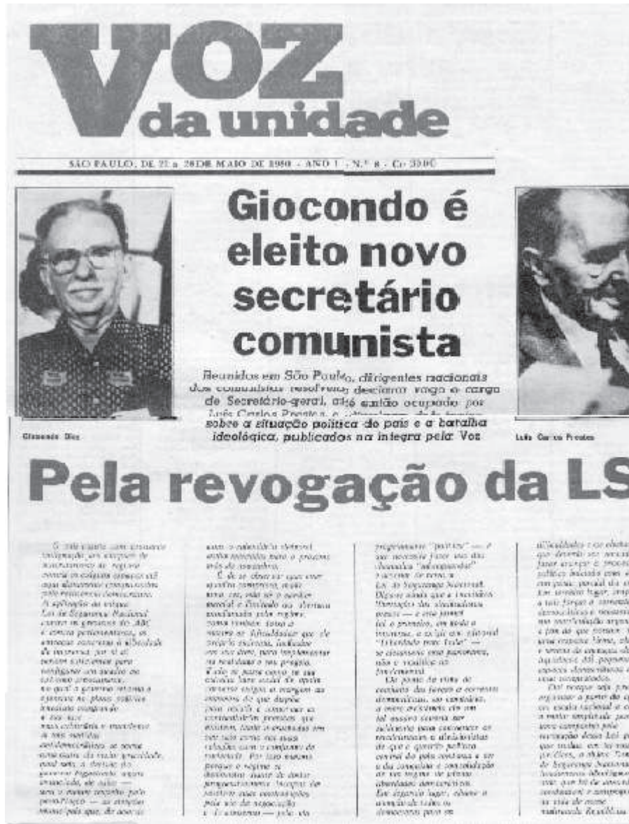
Voz da Unidade. São Paulo, 1980: p.1.