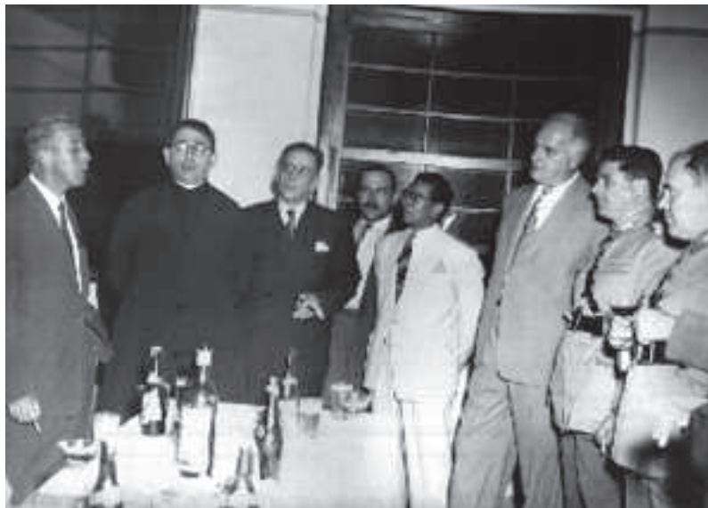
Sessão solene durante o Estado Novo com a presença de autoridades. Porto Alegre, [ca.1941].