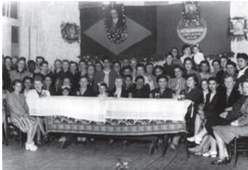
Posse da Diretoria do Sindicato, com a presença de familiares. Porto Alegre, 30 maio 1942.