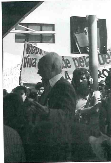
Gregório Bezerra ao chegar do exílio no aeroporto Antônio Carlos Jobim (Galeão), Rio de Janeiro, em 29 de setembro de 1979.