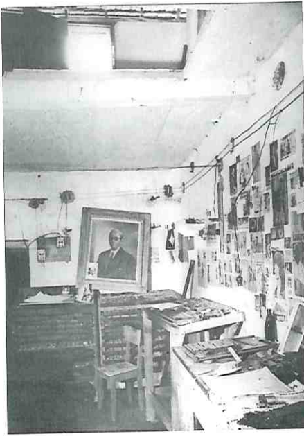
Gráfica clandestina do PCB, Rio de Janeiro, s.d. (Fundo Voz da Unidade, PCB, Arquivo Edgard Leuenroth/UNICAMP, Campinas, SP, foto n. 01904, p. 63).