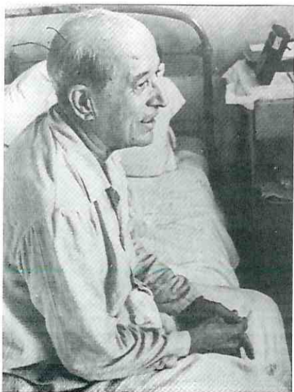
Astrojildo Pereira na prisão. Rio de Janeiro, dezembro de 1964.