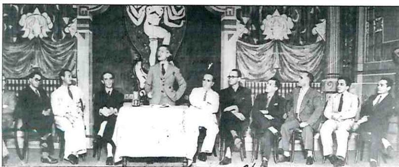
Primeira Assembleia da Aliança Nacional Libertadora (ANL), Santos, SP, 28 de março de 1935. (Fundo Voz da Unidade, PCB, Arquivo Edgard Leuenroth/UNICAMP, Campinas, SP, foto n. 01860, p. 62).