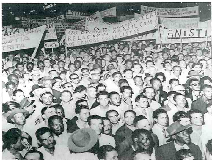
Passeata. Comunistas reivindicam anistia aos processados durante o governo Dutra e reatamento de relações diplomáticas como os países socialistas. Rio de Janeiro, 9 de março de 1956.