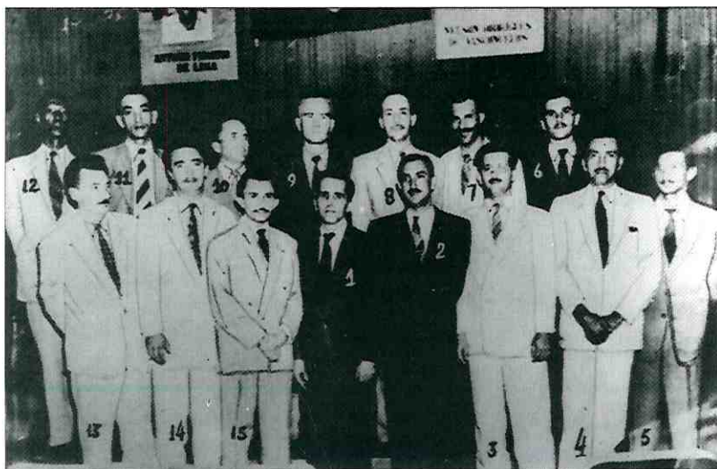
Bancada do PCB na Assembleia Constituinte, 1946.