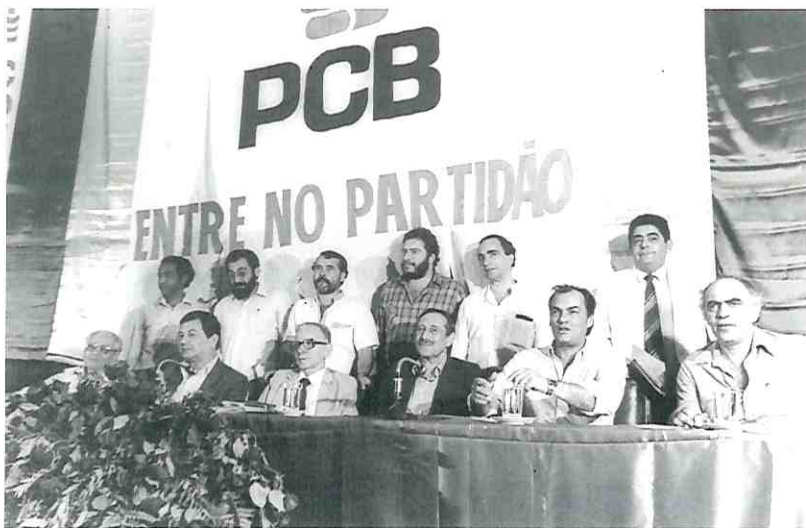
Primeira reunião pública e legal do PCB, realizada na sala Nereu Ramos, Congresso Nacional, Brasília, DF.