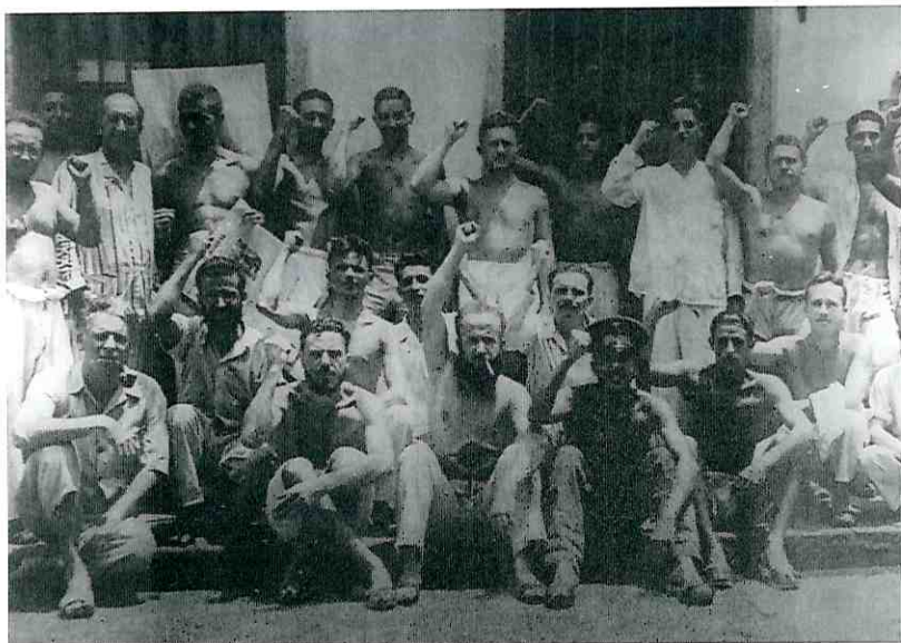
Prisioneiros políticos na Casa de Correção, Rio de Janeiro, 1937. (Fundo Voz da Unidade, PCB, Arquivo Edgard Leuenroth/UNICAMP, Campinas, SP, foto n. 01872, p. 62).